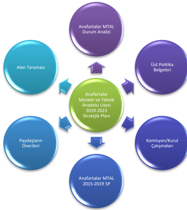
Şekil 1: Anafartalar Mesleki ve Teknik Anadolu Lisesi Stratejik Planlama Modeli

5018 sayılı Kamu Mali Yönetimi Kanunu'nda öngörülen ve stratejik plan hazırlamakla yükümlü kamu idarelerinin ve stratejik planlama sürecine ilişkin takvimin tespiti ile stratejik planların, kalkınma programları ve programlarla ilişkilendirilmesine yönelik usul ve esasların belirlenmesi amacıyla hazırlanan “Kamu İdarelerinde Stratejik Planlamaya İlişkin Usul ve Esaslar Hakkında Yönetmelik ”in (26.05.2006 tarihli ve 26179 sayılı Resmî Gazete) yayımlanmasını müteakiben Milli Eğitim Bakanlığı Strateji Geliştirme Başkanlığının 2013/26 nolu Genelgesi ile ikinci dönem stratejik planlama süreci oluşturulmuştur. Genelge ekinde yer alan hazırlık programında stratejik planlama sürecinde yapılması gerekenler, kurulacak ekip ve kurullar ile sürece ilişkin iş takvimi belirlenmiştir.